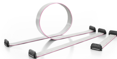
Three standard lengths (0.1 m, 0.2 m, and 0.5 m)