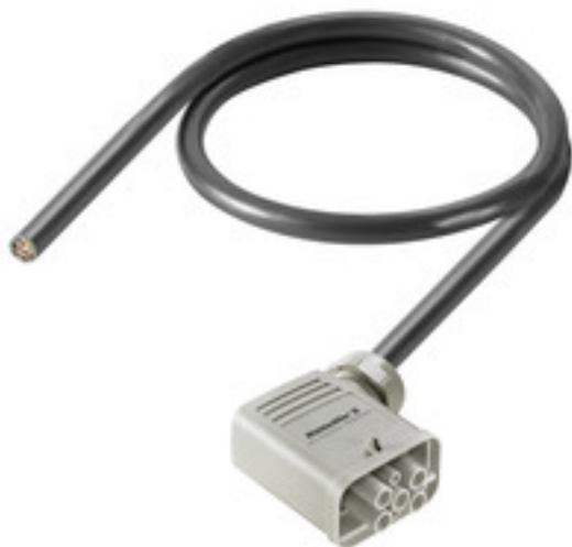
Product similar to illustration