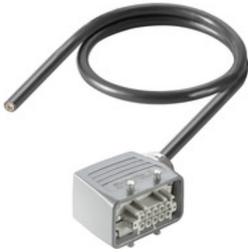
Product similar to illustration