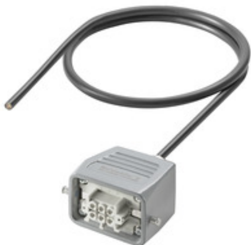
Product similar to the picture