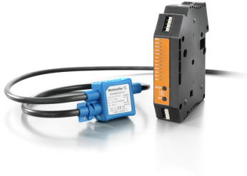
use with Rogowski coil