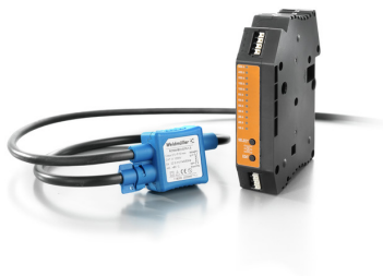
use with Rogowski coil