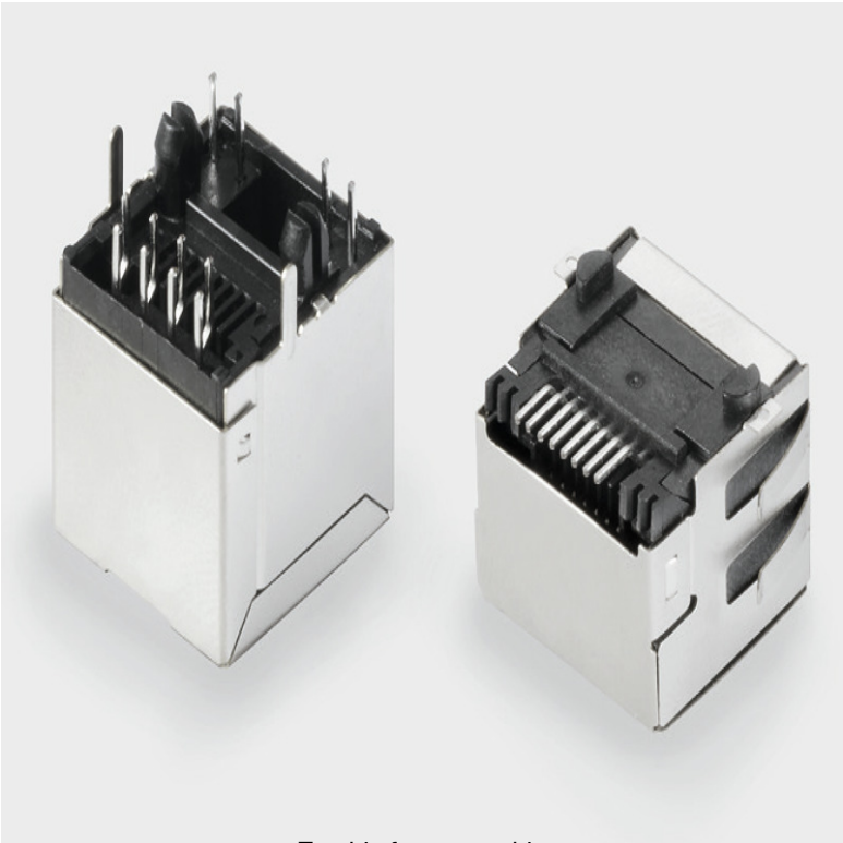
Trouble-free assembly Short, chamfered solder pins

Weidmüller Interface GmbH & Co. KG Klingenbergstraße 26 D-32758 Detmold Germany www.weidmueller.com