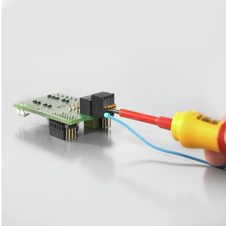
Bedienungssicherheit Durch PUSH IN-Anschluss Technik