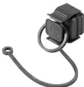
Na ochranu vašich zařízení před prachem a nečistotou.