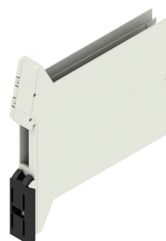
Alapelem busz kivágással