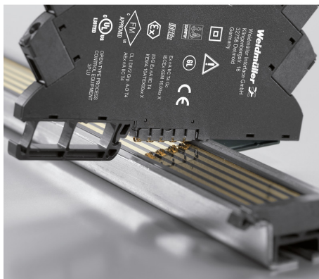
Power supply via the rail bus