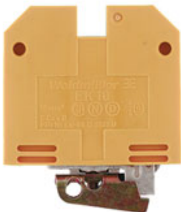
ЕК 10 035466