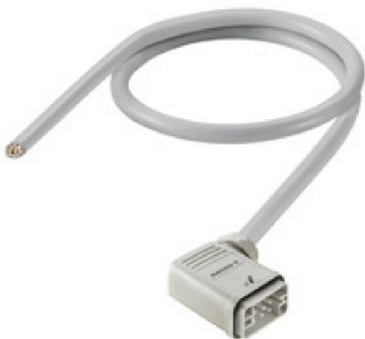
Product similar to illustration