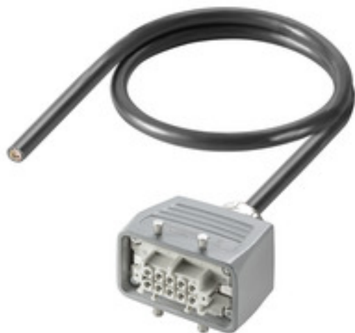
Product similar to illustration