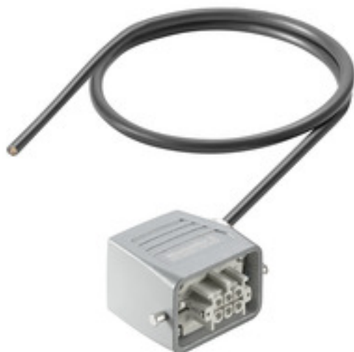
Product similar to the picture