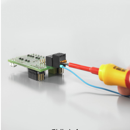
動作安全 PUSH IN接続システム経由