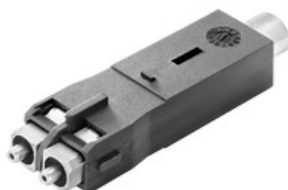
プラグインコネクタ ver.1 / 4 / 14 対応光ファイバー SC インサート