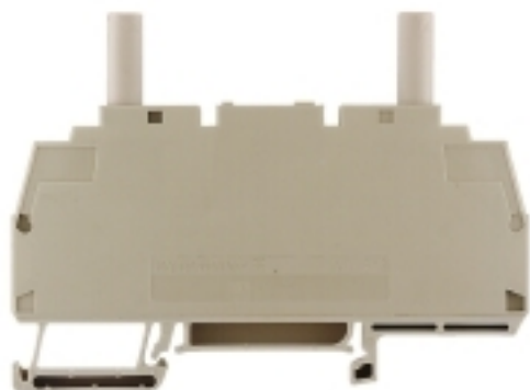
WTL 6/3/STB 101860