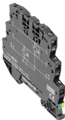
A kép illusztráció