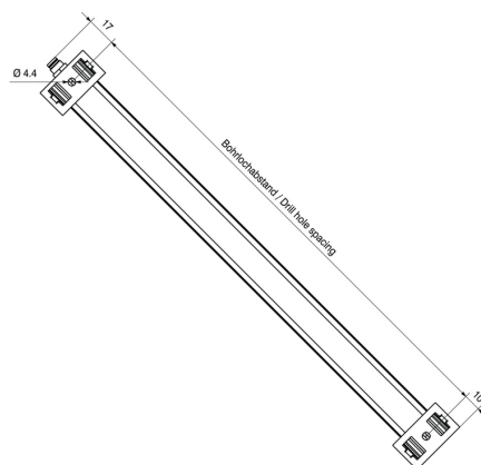
Schéma des pôles