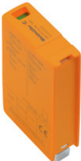
Illustration du produit