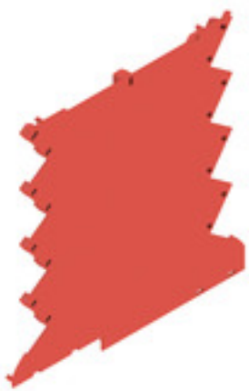
Illustration du produit