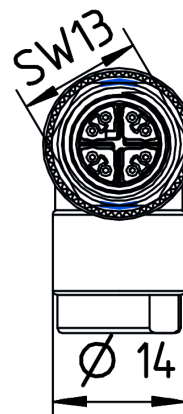
Schéma des pôles