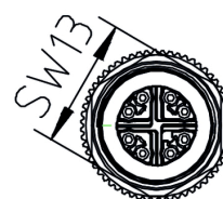
Schéma des pôles