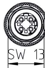
Schéma des pôles