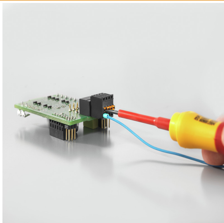
Operating safety Through PUSH IN connection system