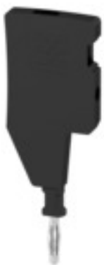
Illustration du produit