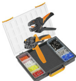
Kits de sertissage