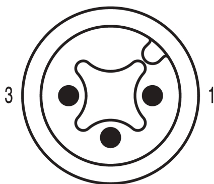
Twin male connector