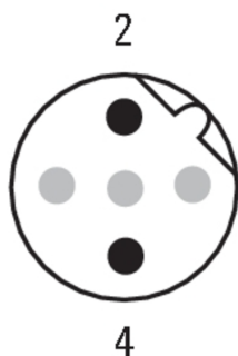
Schéma des pôles