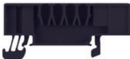
Illustration du produit