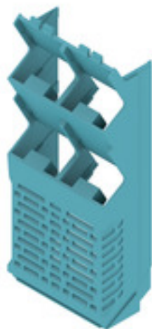
Illustration du produit