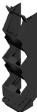
Illustration du produit