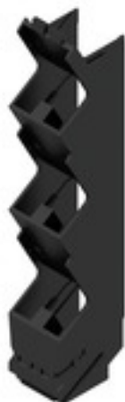
Illustration du produit