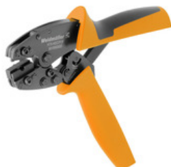
Outils à sertir et dénuder pour traitement de contacts à fibre optique sur fibre polymère (FOP)