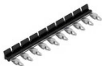
Imagen de producto