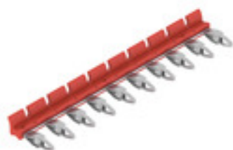
Imagen de producto